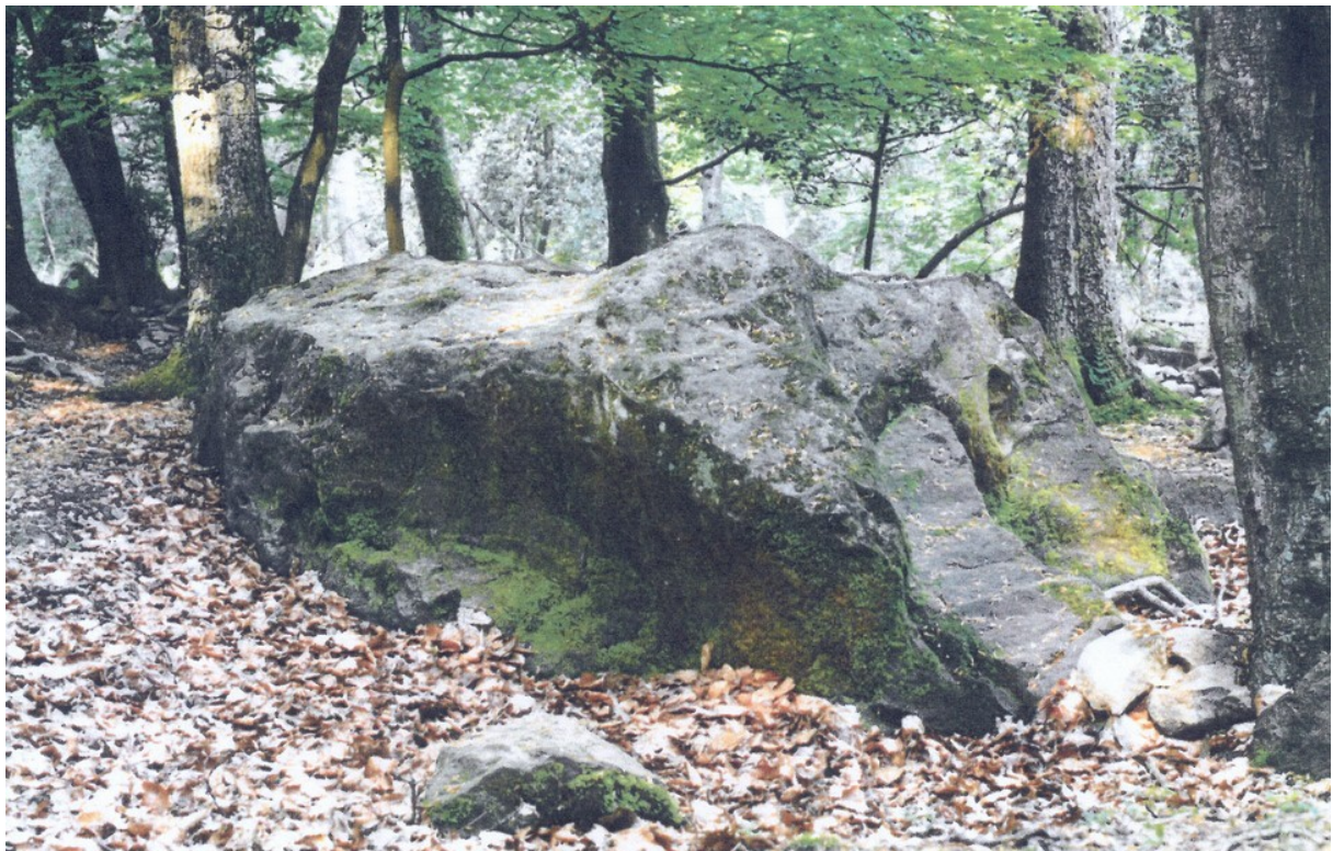
Der Schliepstein-Drache nach seiner archäologischen Freilegung im Mai 1989

Landhotel Haus Weber - 32805 Horn-Bad Meinberg, Hasenwinkel 4