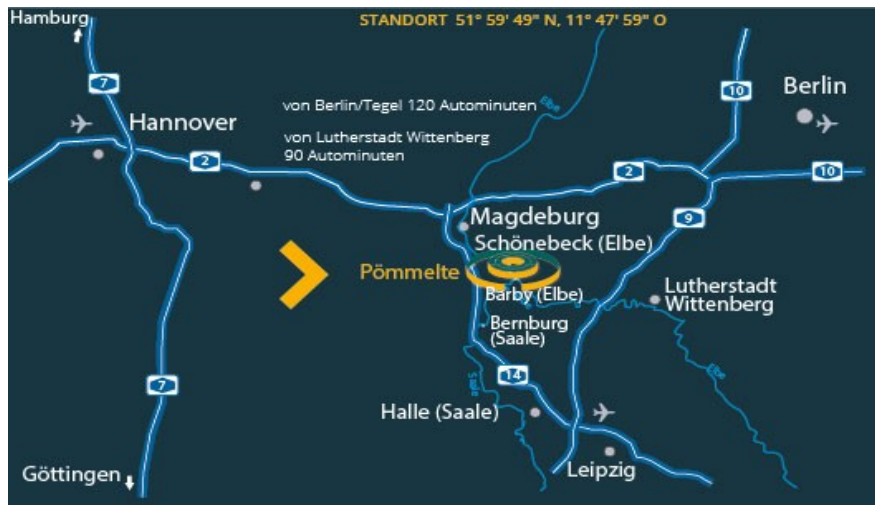
Anfahrt zum Ringheiligtum Pömmelte

Auch der regionalgeschichtliche Teil des Museums, in dem man vieles zur Salzgewinnung in früheren Jahrhunderten erfährt, ist sehenswert (Eintritt 4,-€)